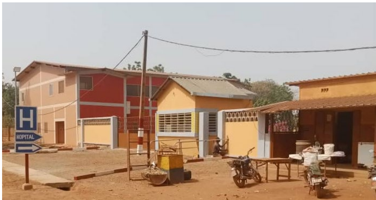
Nuova portineria dell'ospedale di Tanguieta (Benin)

delle Urgenze Pediatriche è stata sostituita da un ascensore che abbiamo potuto ottenere a buon prezzo già versato in parte ed atteso al porto di Cotonou l'8 Marzo.