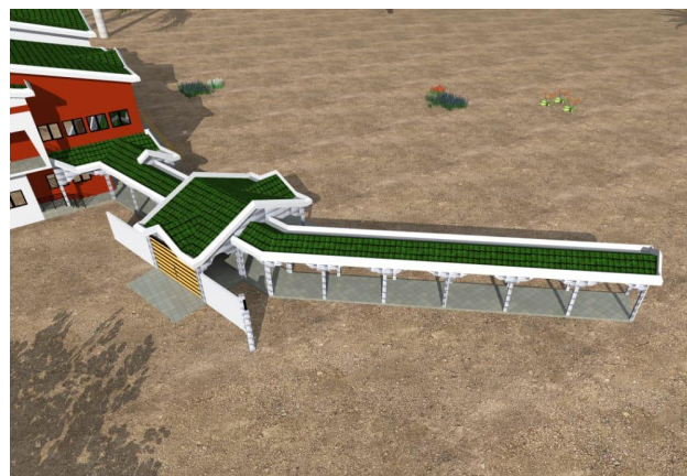
Corridoio coperto di collegamento con i reparti dell'Ospedale

La necessità di costruire una rampa di risalita al primo piano nasce dal fatto che non è possibile attuare il progetto originario di un ascensore interno. Troppo spesso e troppo a lungo viene a mancare la corrente elettrica per cui l'uso dell'ascensore non solo è problematico, ma anche rischioso. Anche il collegamento con i reparti dell'Ospedale mancava nel progetto primigenio, ma è una vera necessità. È stato calcolato che il costo di attuazione di queste due opere è di € 430.000,00 .